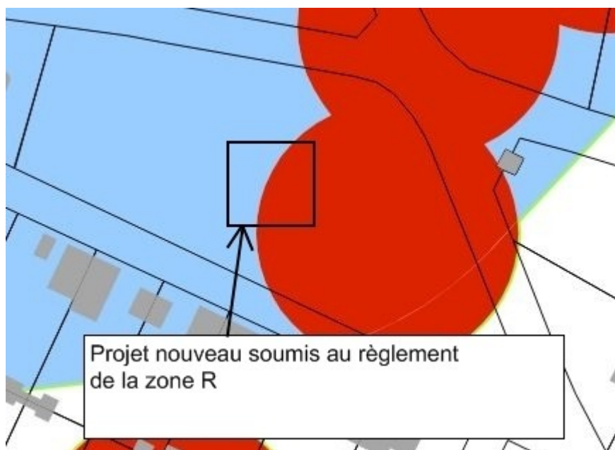
Projet nouveau concerné par plusieurs zones