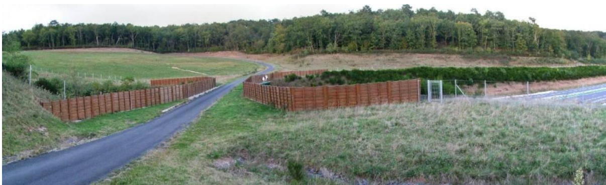
Exemple de passage mixte sur l'A89 (PK 172,1)

Un arrêté ministériel du 21 janvier 2016 publié au JO du 24 janvier 2016 a déclaré d'utilité publique les travaux de construction et d'aménagement de la RN 102 à 2 x 2 voies entre l'autoroute A 75 et l'extrémité de la déviation de Largelier. Il emporte mise en compatibilité du plan d'occupation des sols de la commune de Vergongheon et classe au statut de route express cette nouvelle section et la section existante de la RN 102 correspondant à la déviation de Largelier.