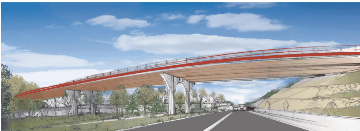
Esquisse du viaduc de la Leuge (1 ère phase de l'opération, au sud d'Arvant)

Afin de réduire le nombre de points de conflits, le nouvel itinéraire se caractérise par un nombre restreint de points d'échange, qui seront dénivelés. Le tracé contourne par le sud la future zone logistique portée par le SYDEC Allier Allagnon, puis le bourg d'Arvant et le hameau des Combes à l'est d'Arvant.