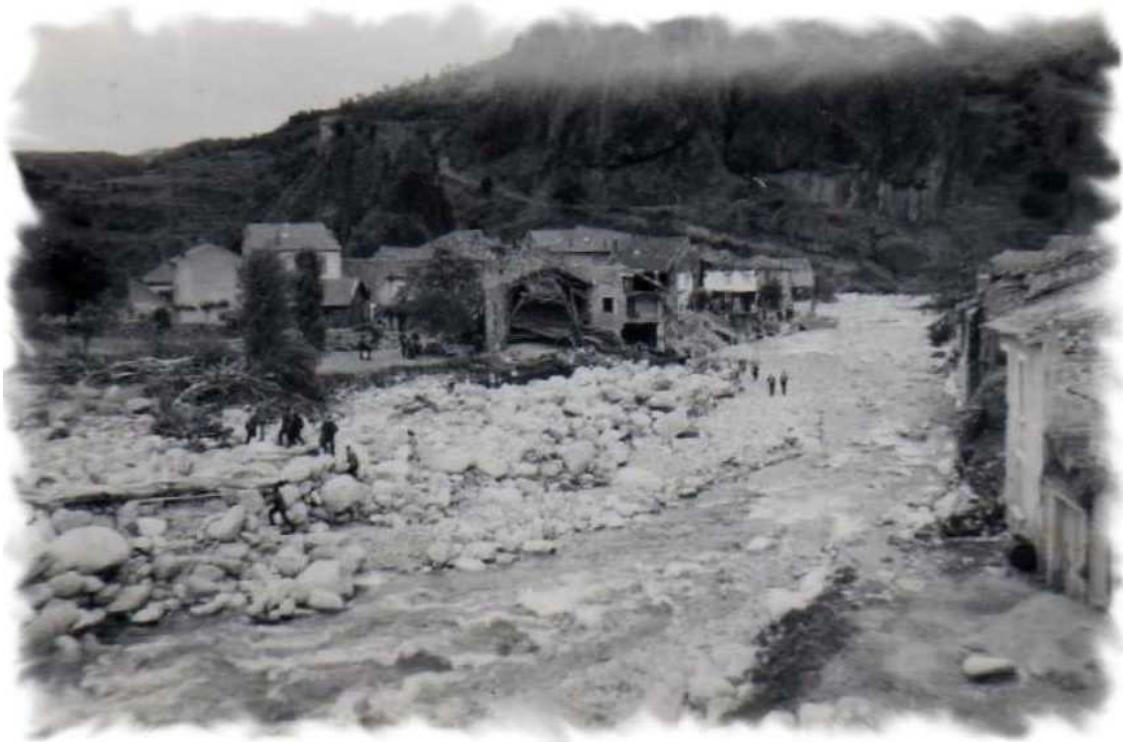
Crue de la Seuge du 16 juin 1951

Plan de Prévention du Risque Inondation de l'Allier, de la Besque et de la Seuge