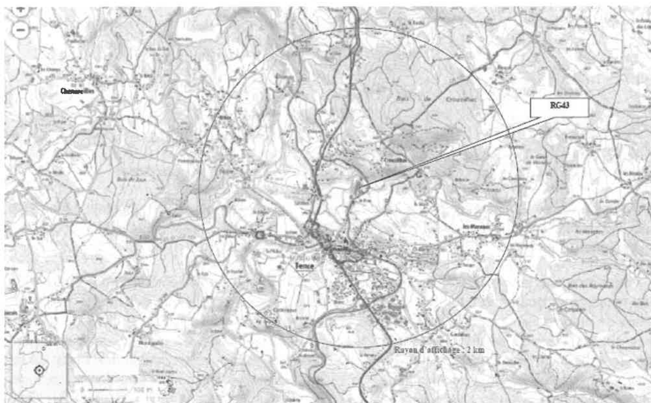
Figure 1 : Localisation du projet. (Source : dossier)

La société RG 43 exploite un site de recyclage de déchets plastiques à Tence, en Haute-Loire, à environ 30 km au nord-est du Puy-en-Velay. Ce site a été exploité depuis 2015 par une autre société ; la société RG 43 a repris l'activité en juillet 2018. Il est situé dans une zone d'activité, dite zone industrielle du Fieu, à 550 m au nord du centre bourg de la commune de Tence. La surface globale du site est d'environ 213 780 m 2 ; il n'est pas prévu que le projet s'étende.